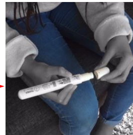
Enlevez le bouchon blanc