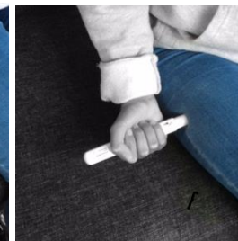
Appuyez fermement et maintenez appuyé pendant 5 secondes