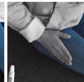
Puis massez la zone d'injection